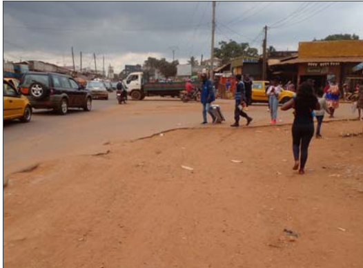
On circule mieux

Pour l'effectivité de cette normalisation, une mesure phare est prise: la construction