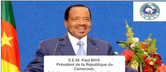
Le président dédié de la rationalisation des CERs touche au but

Sous la houlette du président du Comité de pilotage de ce processus, un Conseil des ministres va se tenir à Yaoundé du 9 au 12 août prochain. A l'effet d'examiner et valider les textes fondateurs de la Communauté unique proposés par les experts.