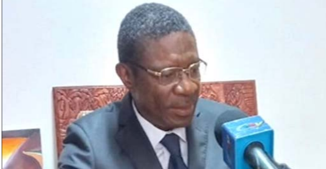
Luc Messi Atangana, le maire de Yaoundé

Dévoilée par Luc Messi Atangana, la liste des projets destinés à limiter l'ampleur des inondations à Yaoundé laisse en suspens la question du «quand».