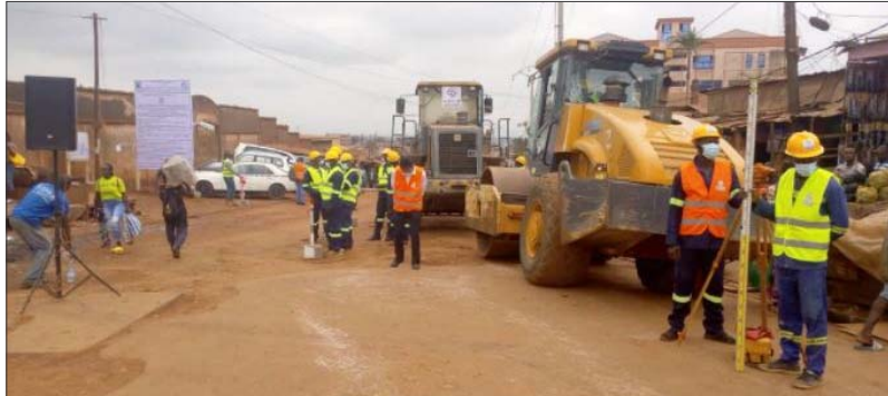
travaux de construction de 15 km de route à Nkolmesseng

Quelques 200 millions FCFA supplémentaires sont envisagés en réponse à des cas d'omission de propriétaires de biens impactés. «Il y a un mécanisme de gestion des plaintes des populations qui a été mis en place dans le cadre de ce projet. Tous les sectoriels concernés sont représentés et en ce moment, les cas d'omission sont en train d'être examinés. Il y a une série de documents qui doi-