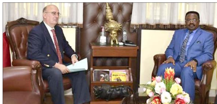
Ambassadeur d'Italie au Minrex

De ce point de vue, le lobbying et le marketing apparaissent comme les deux dimensions saillantes de l'audience accordée à l'ambassadeur d'Italie au Minrex le 30 juin dernier. Un facteur d'explication déterminant est certainement que, l'Arabie Saoudite (également candidate à l'organisation de l'Exposition universelle 2030) a clairement révélé un souci de positionnement auprès de la Commission de la Cemac. A ce sujet, Ahmed bin Abdul-Aziz Kattan (Conseiller à