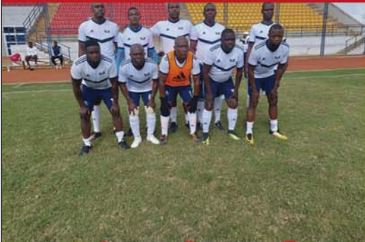
V. A. C