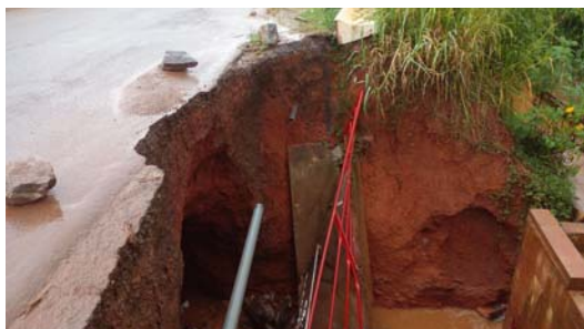
La confiance des riverains et usagers de cette route au fond du trou

Et ce jeudi 7 juillet 2022, après la pluie aux environs de 16 heures, une grosse frayeuse s'est emparée des menusiers possédant un atelier tout prêt. Angoula, l'un d'eux, dit avoir suivi des énormes bruits venant de cet endroit. Lorsque l'on se rap-