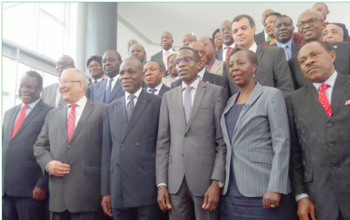
Photo d'ouverture de la conférence des ministres à Libreville.

« Le processus de la réforme institutionnelle est en très bonne voie et pourrait