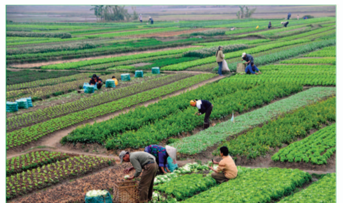
L'agriculture, un défi à relever en Afrique centrale.

Le chiffre est de la Commission économique du bétail, de la viande et des ressources halieutiques (Cebevirha). L'agence d'exécution de la Communauté Economique et Monétaire de l'Afrique Centrale (CEMAC) veut lever 150 milliards pour réaliser sa vision qui est de faire de la cebevirha à l'horizon 2025, une institution de référence pour les Etats et les partenaires en matière d'appui au développement durable des ressources animales, halieutiques, aquacoles et des échanges au bénéfice des populations de la Communauté. La situation socio-économique de la zone CEMAC est caractérisée par la pauvreté et l'insécurité alimentaire. Ces deux phénomènes sociaux déjà très répandus dans la CEMAC se sont aggravés durant les dix dernières années à cause des crises socio-économiques qui ont secoué la plupart des pays membres de la CEMAC et les pays voisins. La conjoncture actuelle est à la diversification et à l'introduction des économies de la sous-région. Afin de se positionner comme cheville ouvrière de l'accroissement de la productivité et de la création des chaînes de valeurs agricoles,