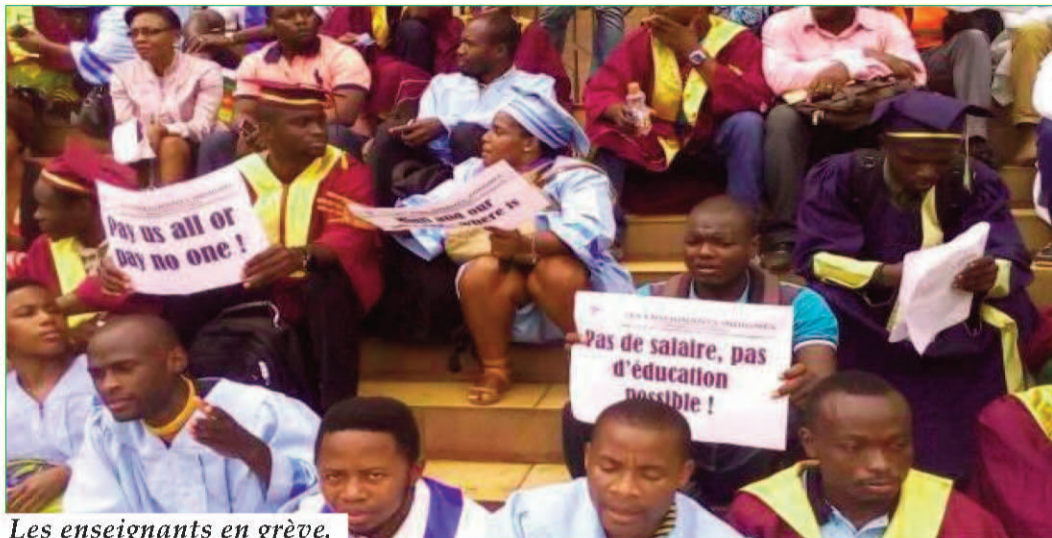
Les enseignants en grève.

des autorités publiques en charge des dossiers d'intégration et d'avancements. «Tout cela est suffisamment intéressant pour permettre au gens avides de gloire vers le sommet. Pour cela ils sont assez habiles pour se projeter eux-mêmes en première ligne en affichant souvent avec un certain bluff leur fantasme», analyse Protails Nkoudou.