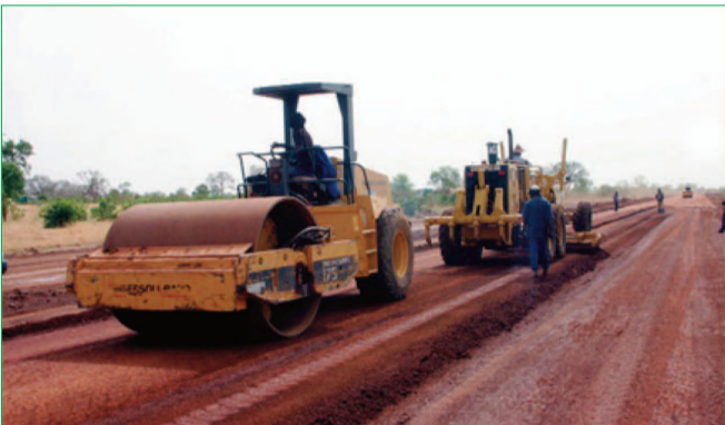
Une route en chantier.

En hibernation depuis la 7 ème réunion de son organe de suivi tenue à Yaoundé en avril 2016, le Plan Directeur Consensuel des Transports en Afrique Centrale (PDCT-AC) vient de connaître un grand coup de dépoussiérage. Le processus engagé va vers une programmation 2018-2019 qui s'articule principalement autour de l'organisation des prochaines réunions des organes du PDCT-AC, l'étude d'actualisation de la priorisation des projets du PDCT-AC, l'organisation de la table ronde des bailleurs de fonds, le redéploiement dans la sous-région du Système d'Information Géographique du PDCT-AC et la redynamisation du site internet. Le nettoyage des textes va également permettre de donner une perspective comptable à l'institution